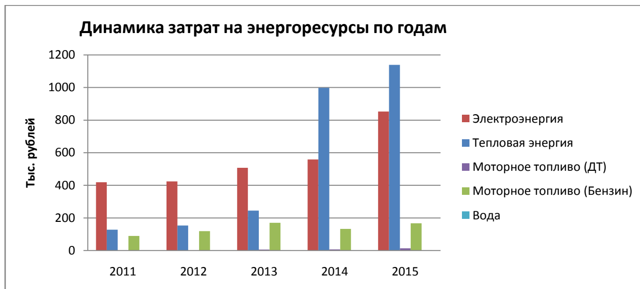
Рисунок 1 - Баланс затрат на энергоресурсы

Динамика роста цен на энергоносители предопределяет экономические условия для интенсификации работы по энергосбережению.