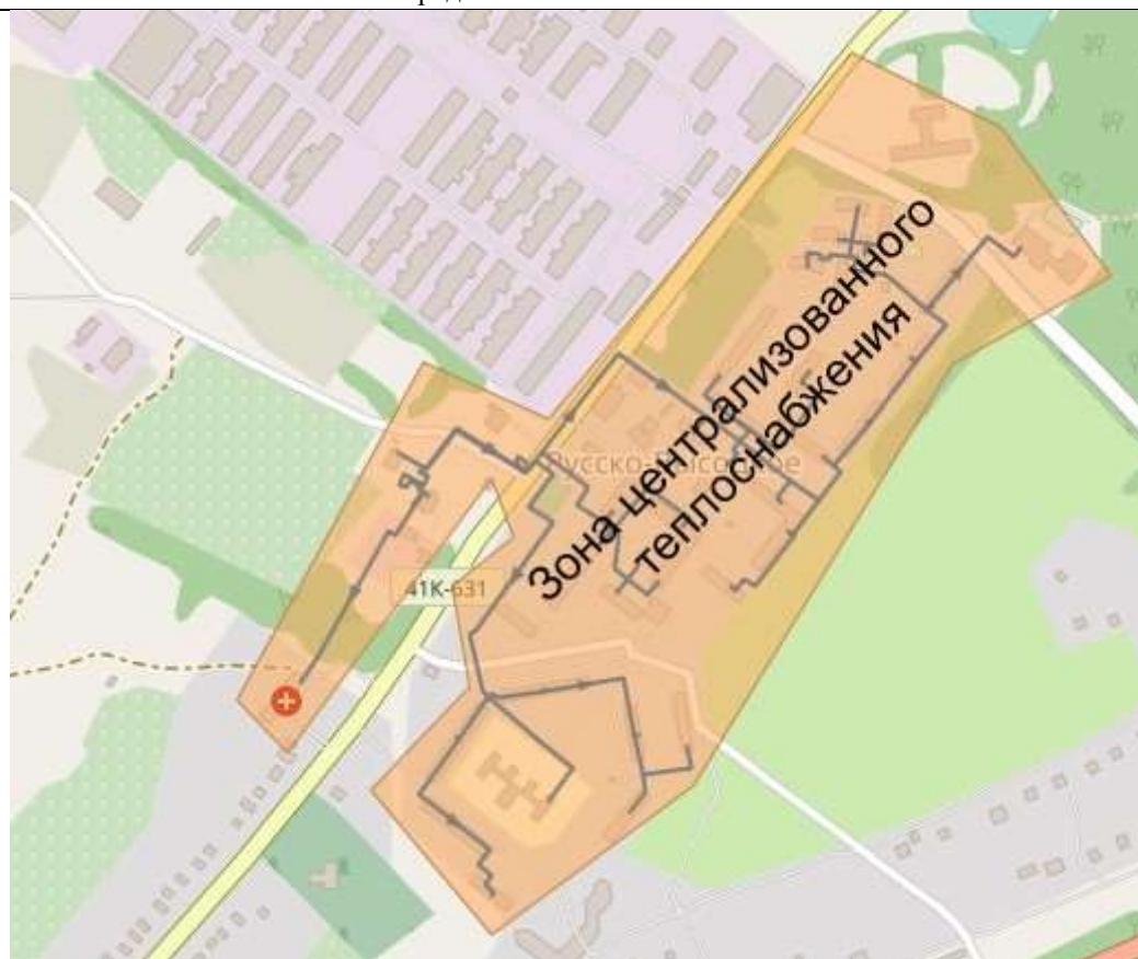
Рисунок 2. Перспективная зона централизованного теплоснабжения